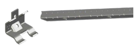
Clé d'encreage EziKi et bande de départ