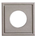
Plaque 4" et 6"